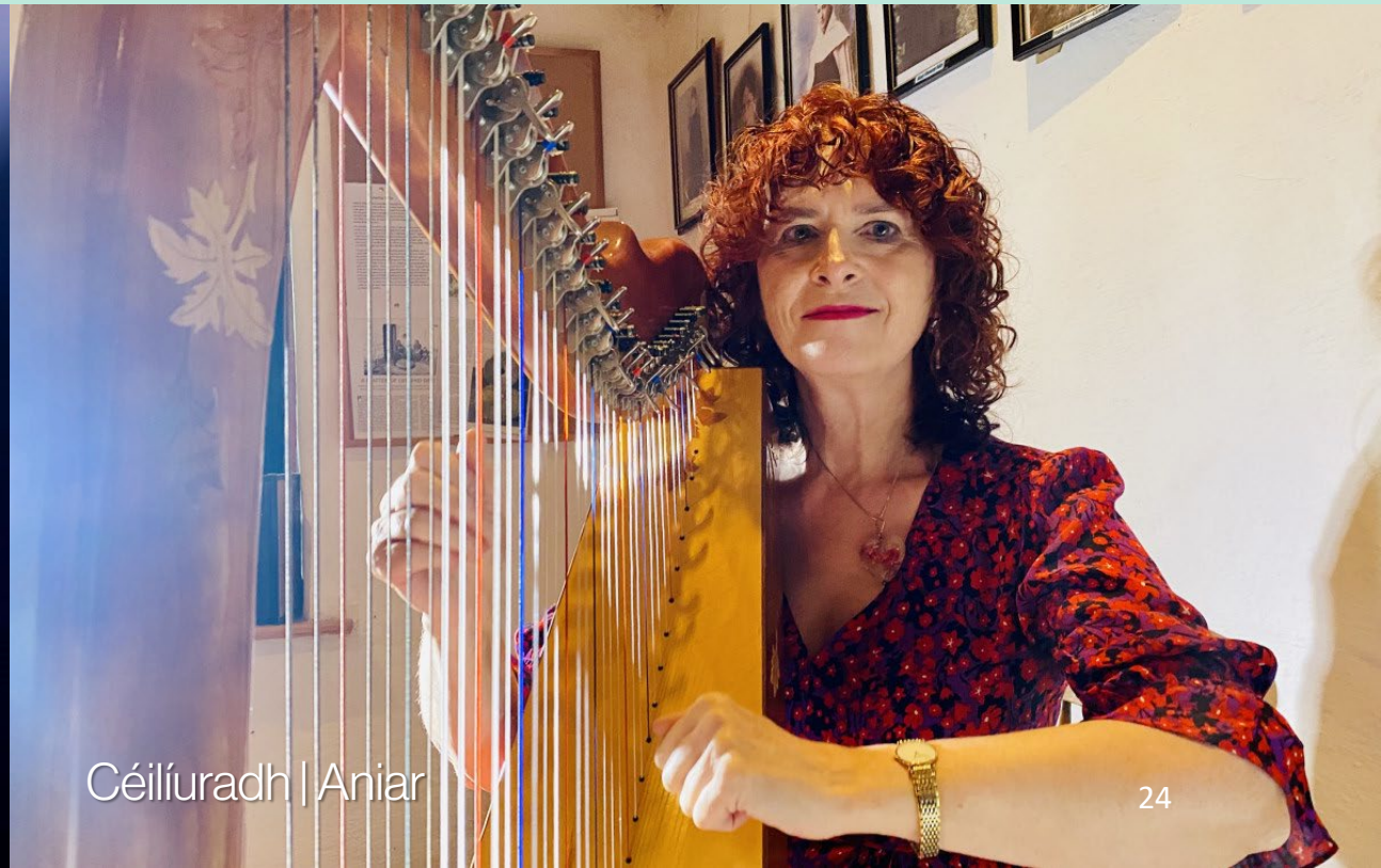
Céilíuradh | Aniar