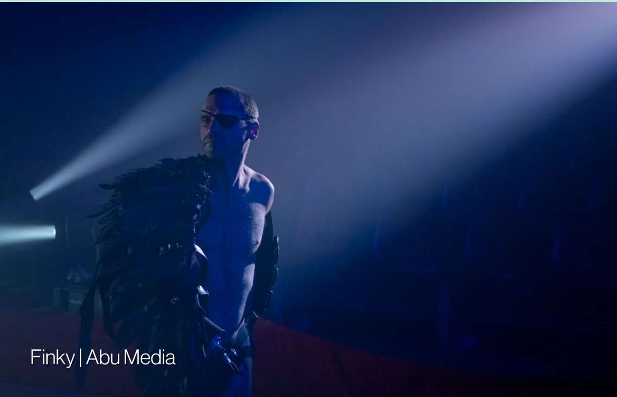
Finky | Abu Media

Samhlaímid earnáil léiriúcháin na Gaeilge a bheidh uailmhianach, a bheidh san iomaíocht go hidirnáisiúnta, a chruthóidh ábhar an-láidir do lucht éisteachta/féachana na hÉireann agus idirnáisiúnta agus a chothóidh gairmeacha na tallainne cruthaithí is fearr ar an oileán seo. Is féidir an fhís sin a bhaint amach, ach ní féidir linn é a dhéanamh gan fís agus tacaíocht an rialtais, agus go sonrach gníomhú ar na moltaí atá leagtha amach san aighneacht seo.