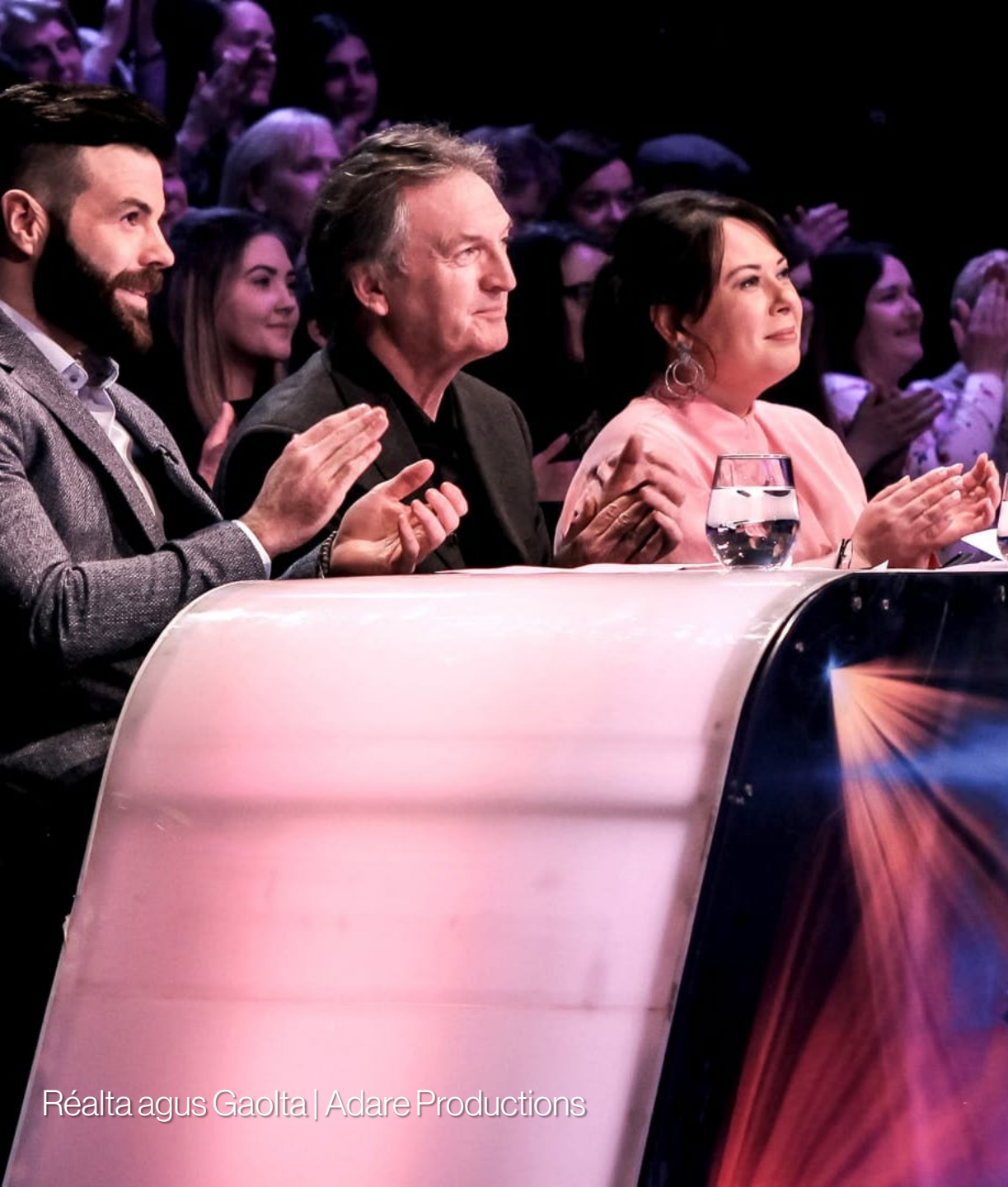
Réalta agus Gaolta | Adare Productions